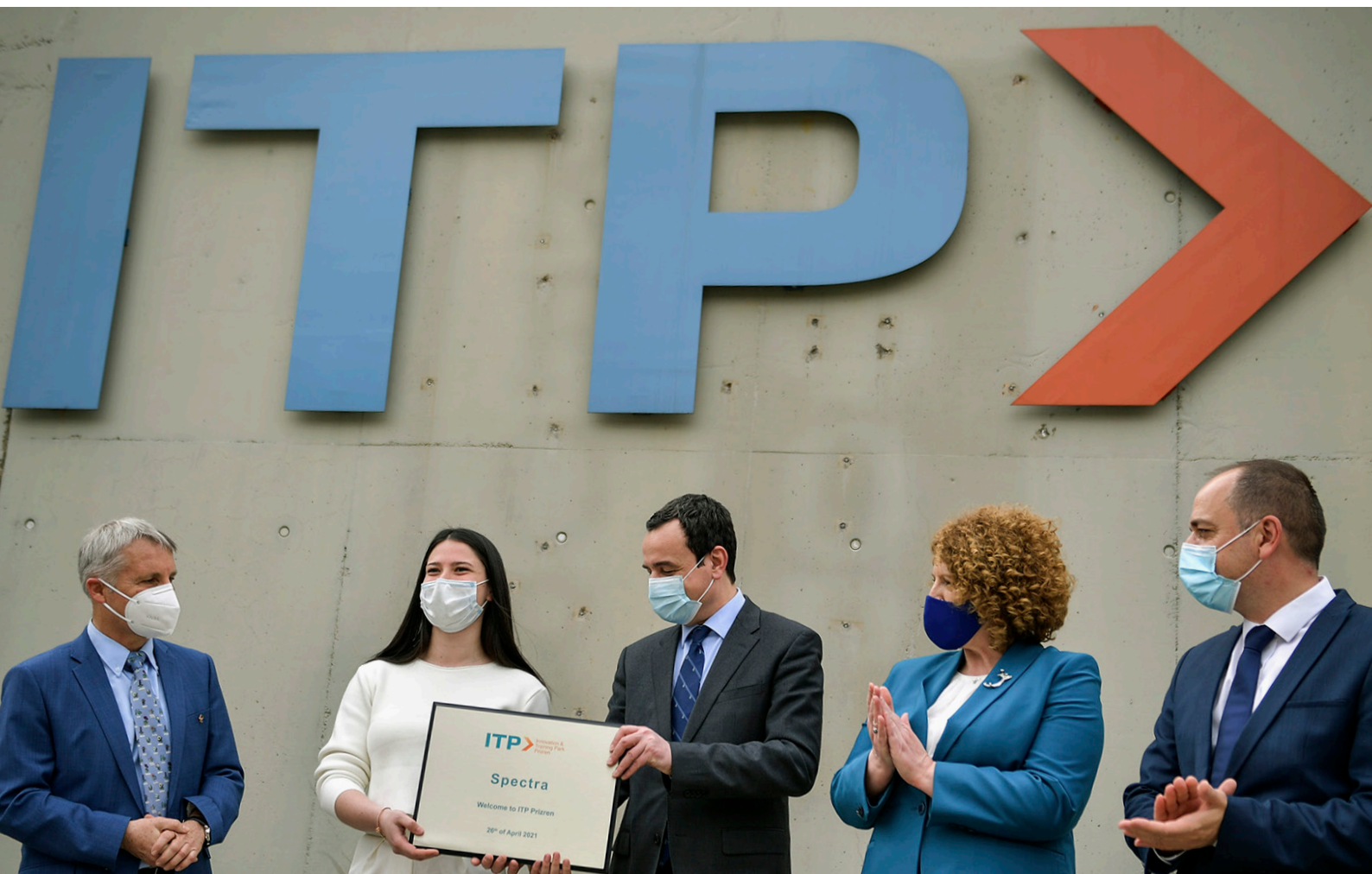
Kryeministri Albin Kurti dhe ministrja e Industrisë, Ndërmarrësisë dhe Tregtisë, Rozeta Hajdari në ceremoninë e pritjes së bizneseve të para në Parkun të Biznesit në Prizren.

Në fushën e telekomunikacionit dhe teknologjisë informative e komunikuese, Qeveria ka miratuar Projektligjin për Identifikimin Elektronik dhe Shërbimet e Besueshme për Transaksionet Elektronike dhe Projektligjin për Masat për Uljen e Kostos së Shtrirjes së Rrjeteve të Komunikimeve Elektronike të Shpejtësisë së Lartë. Në këtë drejtim, projekti i Shtrirjes së Infrastrukturës brezgjere në zona të pambuluara përmes programit