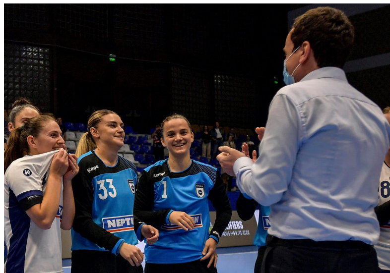
Kryeministri Albin Kurti dhe hendbollistet e përfaqësueses së Kosovës pas ndeshjes Kosovë - Luksemburg (33:27).

Brenda 100 ditëve, janë lincencuar 40 federata sportive vendore. Për herë të parë, licencimi është bërë në afat kohor një vjeçar. Procesi i licencimit të rregullt do të realizohet në muajin e parë të vitit 2022 dhe janë nënshkruar memorandumet e bashkëpunimit me 40 federata sportive, me Komitetin Olimpik të Kosovës dhe Komitetin Paralimpik të Kosovës. Vlera totale e subvencionimit është mbi 2 milionë euro, ndërsa do të sigurohen fonde shtesë për përkrahjen e ngjarjeve të rëndësishme sportive me karakter ndërkombëtar, për organizimin e Kampionatit Botëror të Hendbollit Universitar që do të mbahet në Kosovë.