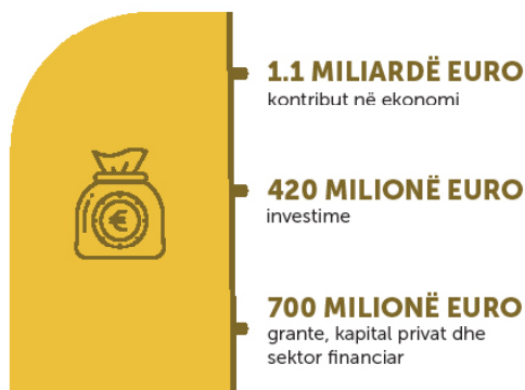
Fig. 1. Pakoja e Ringjalljes Ekonomike

Pakaja e Ringjalljes Ekonomike përmban gjithsej investime prej 420 milionë euro të cilat priten të mobilizojnë edhe rreth 700 milionë euro tjera nga grantet, kapitali privat, dhe sektori financiar, për një shumë totale prej rreth 1.1 miliardë euro kontribut në ekonomi.