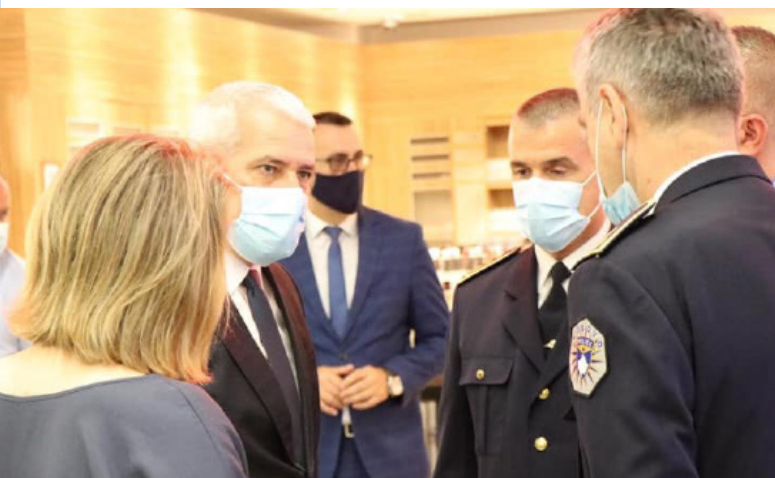
Ministri i Punëve të Brendshme, Xhelal Svecła vizitë Doganave dhe Aeroportit të Kosovës

Policia e Kosovës ka përmbyllur me sukses operacionin ndaj dy grupeve kriminale të përfshira në veprën penale "Pjesëmarrja ose Organizimi i Grupit Kriminal të Organizuar" që lidhen me kontrabandë me migrantë dhe falsifikim i dokumenteve.