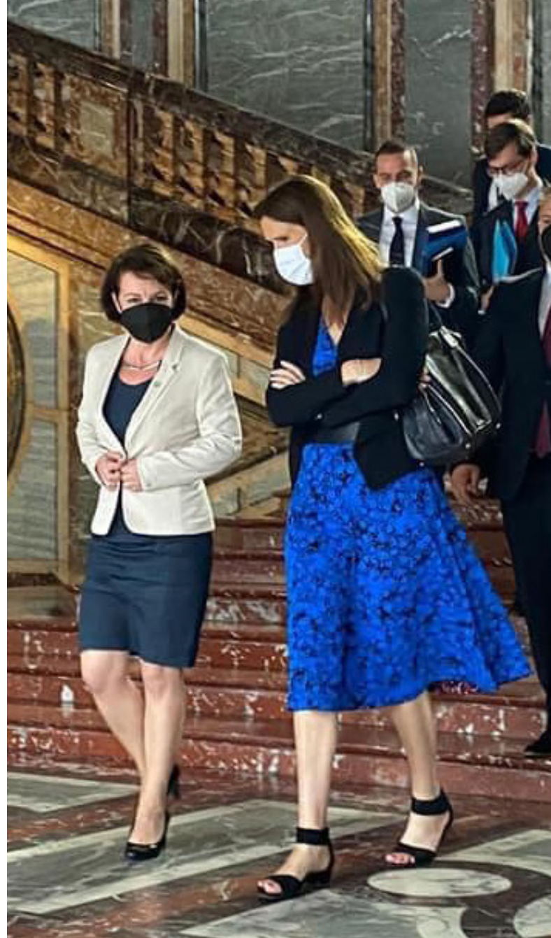
Zëvendëskryeministrja dhe ministrja e Punëve të Jashtme dhe Diasporës, Donika Gërvalla në takim me zëvendëskryeminstren e Belgjikës dhe ministren e Punëve të Jashtme, Çështjeve Evropiane dhe Tregti të Jashtme, dhe Institucioneve Federale të Kulturës, Sophie Wilmès.

Kurse, nëpërmjet Ministrisë së Kulturës, Rinisë dhe Sportit, Kosova për herë të parë i ka bërë kërkesa zyrtare Serbisë për kthimin e 1247 artefakteve të grabitura para më shumë se 20 vjetëve e të cilat vazhdon t'i mbajë padrejtësisht dhe në kundërshtim me marrëveshjet paraprake, konventën e UNESCO-s mbi pasurinë kulturore dhe Planin e Ahtisaarit.