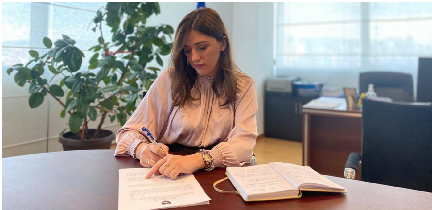
Ministrja e Drejtësisë, Albulena Haxhiu duke proceduar në Qeveri koncept dokumenin për konfiskimin e pasurisë së pajustificueshme.

Një prej koncept dokumenteve të para të miratuara nga Qeveria, që në mbledhjen e gjashtë, ishte Koncept Dokumenti për çështjen e pasurisë së fituar në mënyrë të pajustificueshme. Pas miratimit të tij,